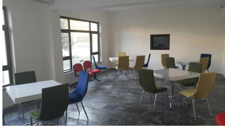
Öđrenci Dinlenme Alanları