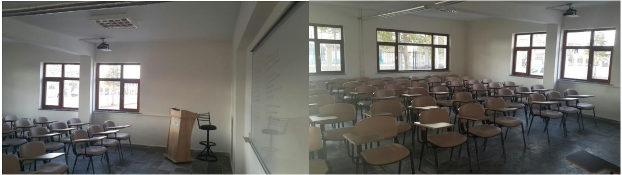
Ahi Evran Dersliđi