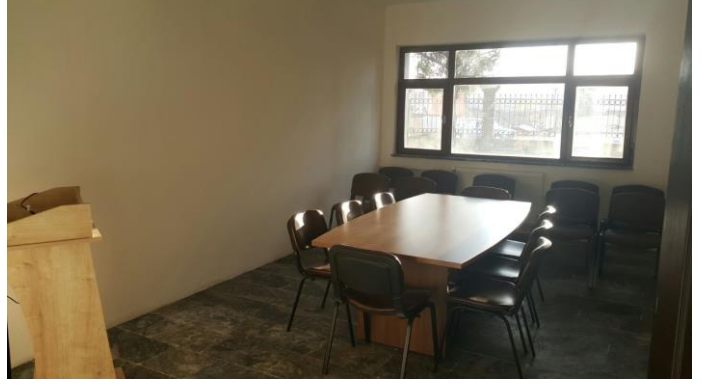
Yunus Emre Dersliđi