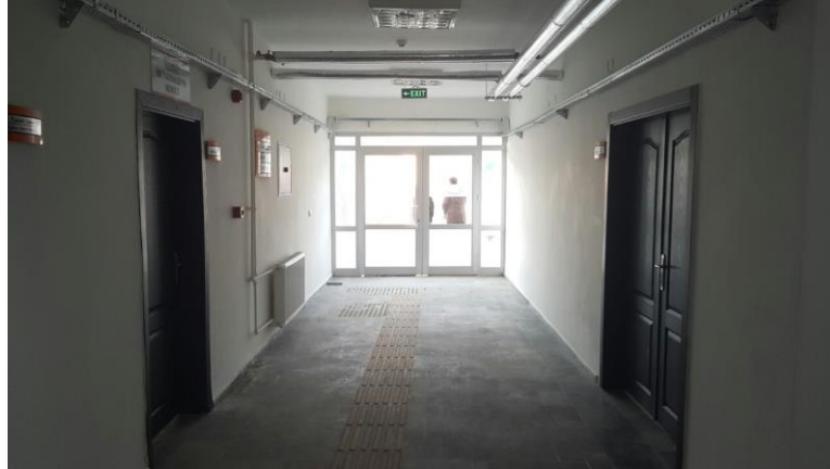
AESEM Giriş Koridoru