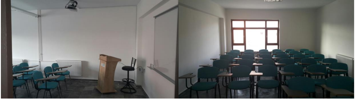
Aşık Paşa Dersliđi